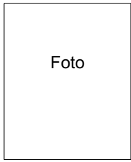
Fotografía del titular